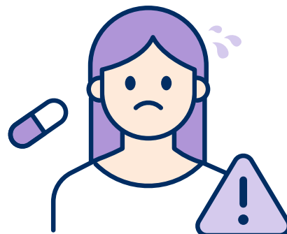
환자 고유의 체질