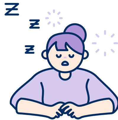
의약품 자체의 특성